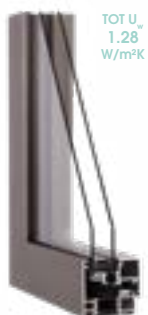
DRITTO Inviso 70 mm

Profel doet haar uiterste best om de info in deze folder correct weer te geven. Aan de informatie en het beeldmateriaal kunnen echter geen rechten worden ontleend. Voor eventuele fouten kan Profel op geen enkele manier aansprakelijk worden gesteld.