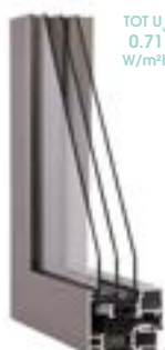
DRITTO Inviso 84 mm