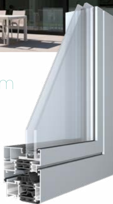
RECTO 80 met Fino-vleugel