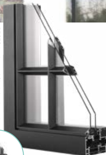
Buitenaanzicht RECTO 80 *Binnenzijde RECTO 80/ RECTOBLOC 106