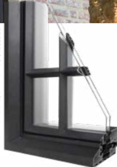
Buitenaanzicht RECTOBLOC 106

Dé perfecte imitatie van het authentieke stalen raam. Met deze aluminiumreeks zet Profel volop in op (ver)bouwers die hun woning graag een nostalgisch tintje geven. Met eigentijdse prestaties, welteverstaan. Het superisolerende raam koppelt veiligheid aan esthetiek en met een aanzichthoogte van slechts 65.5 mm is het predicaat 'ultraslank' niet gestolen.